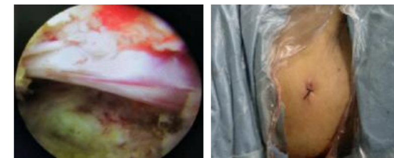
术中见神经根充分减压(左图)。术后伤口只缝一针(右图)。