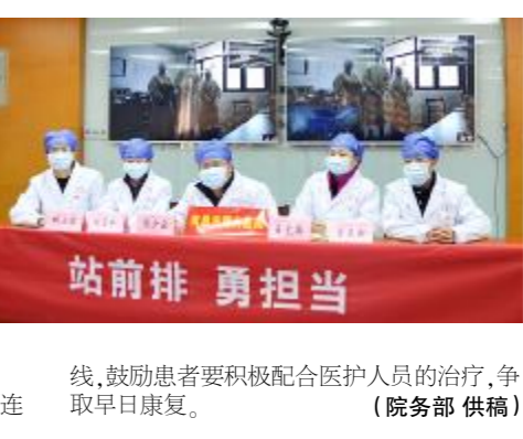
省委书记刘奇视频连线慰问医院抗疫一线医护人员

刘奇书记在听完汇报后指出，南昌市第九医院作为市级定点救治医院，是南昌市新冠肺炎疫情防控工作的主力军。突如其来的疫情是对各级党委和政府的考验，也是对各级党委医疗机构的考验。