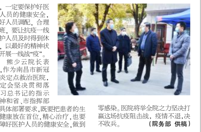
省卫生健康委副主任曾传美一行来院调研

2月18日上午，省卫生健康委副主任曾传美一行来到医院调研新型冠状病毒肺炎疫情防控工作。