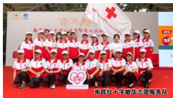
南昌红十字敬华志愿服务队