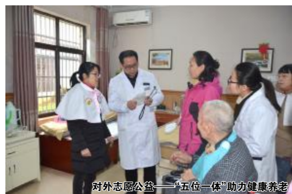
对外志愿公益——“五位一体”助力健康养老

站在新起点,南昌市第九医院党委将进一步创新党建工作举措,通过党建工作的创新引领医院在高质量发展道路上不断前行,为人民群众提供更为优质高效的医疗服务,为实现健康中国梦贡献更大力量。(张小芳)