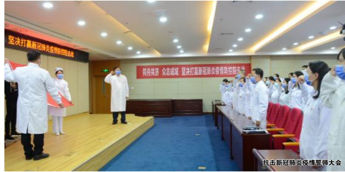
抗击新冠肺炎疫情誓师大会

推选“党员示范岗”是在战“疫”关键时期和日常工作中凝心聚力、鼓舞士气的有效方法,更是进一步强化落实主体责任,压实防控职责和工作职责的有力举措。自设立“党员示范岗”以来,十个示范岗充分发挥党员的先锋模范作用,带动所在科室的职工积极工作,认真履责,成为医院落实党政各项工作的标杆,使党旗始终在疫情防控一线和日常医疗服务中高高飘扬。同时,全院各科室在党员示范岗