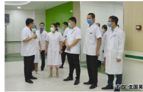
9月10日上午，市政府副市长龙国英莅临医院调研发热门诊建设工作。市政府副秘书长黄琰，市卫健委党委书记、市